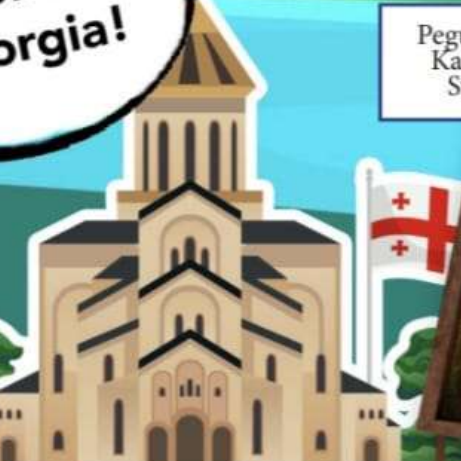
Pegunungan Kaukasus, Svaneti